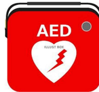
↑ 高齢者生活福祉センター「福寿草」内にもAEDが設置されています。