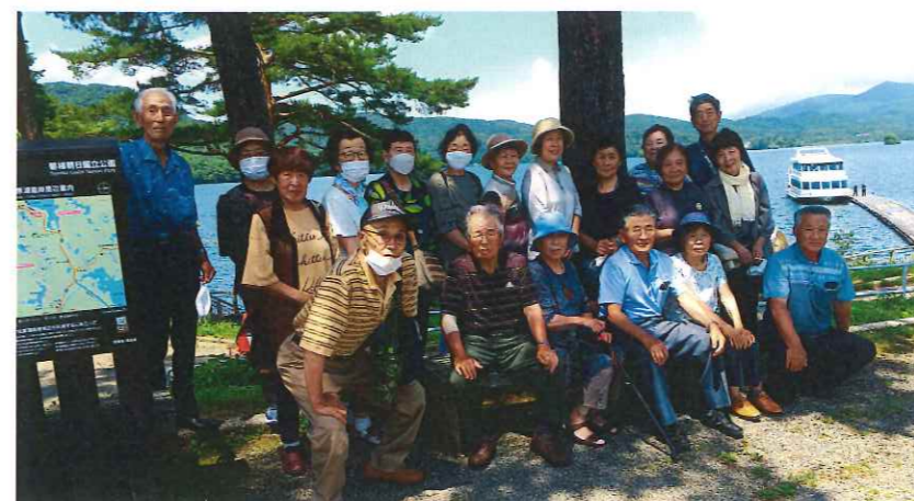
写真撮影に際し、一時的にマスクを外しています。