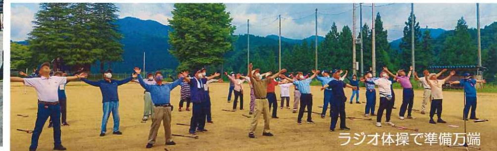
ラジオ体操で準備万端

梅雨の晴れ間となった7月3日、「令和5年度三島町社会福祉協議会会長杯グラウンドゴルフ大会」が開催され、41名の皆様にご参集くださいました。コロナの感染症法上の位置づけが5類へ移行となつて初めての大会とあつて、歓声と笑い声があふれ、人や地域とのつながり、活動することの大切さを改めて実感できた一日となりました。