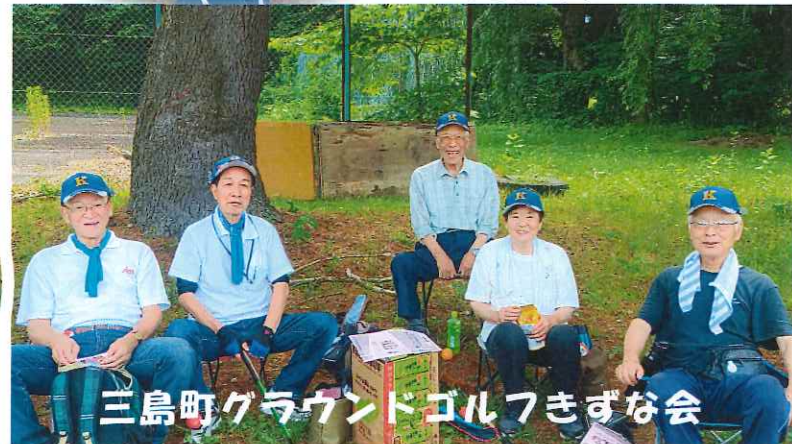
三島町グラウンドゴルフきずな会