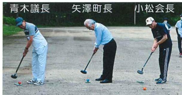
参加者の熱い視線の中、緊張の始球式☆