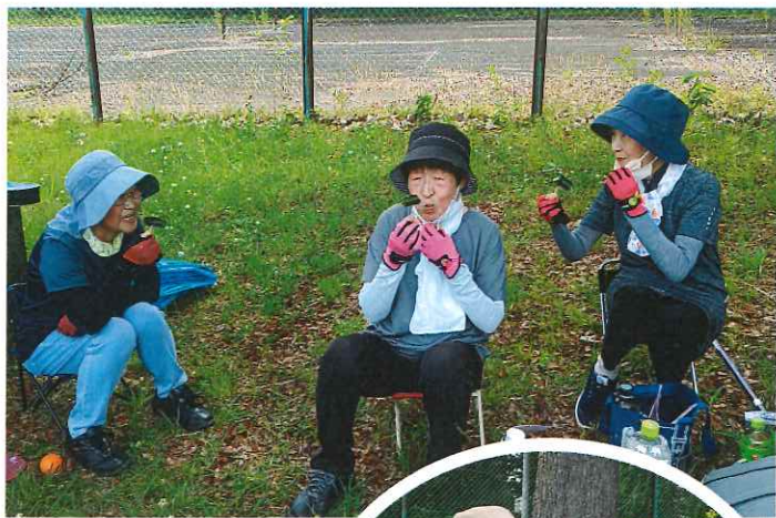
休憩中の もぐもぐタイム キュウリ漬けで 水分と塩分補給◎