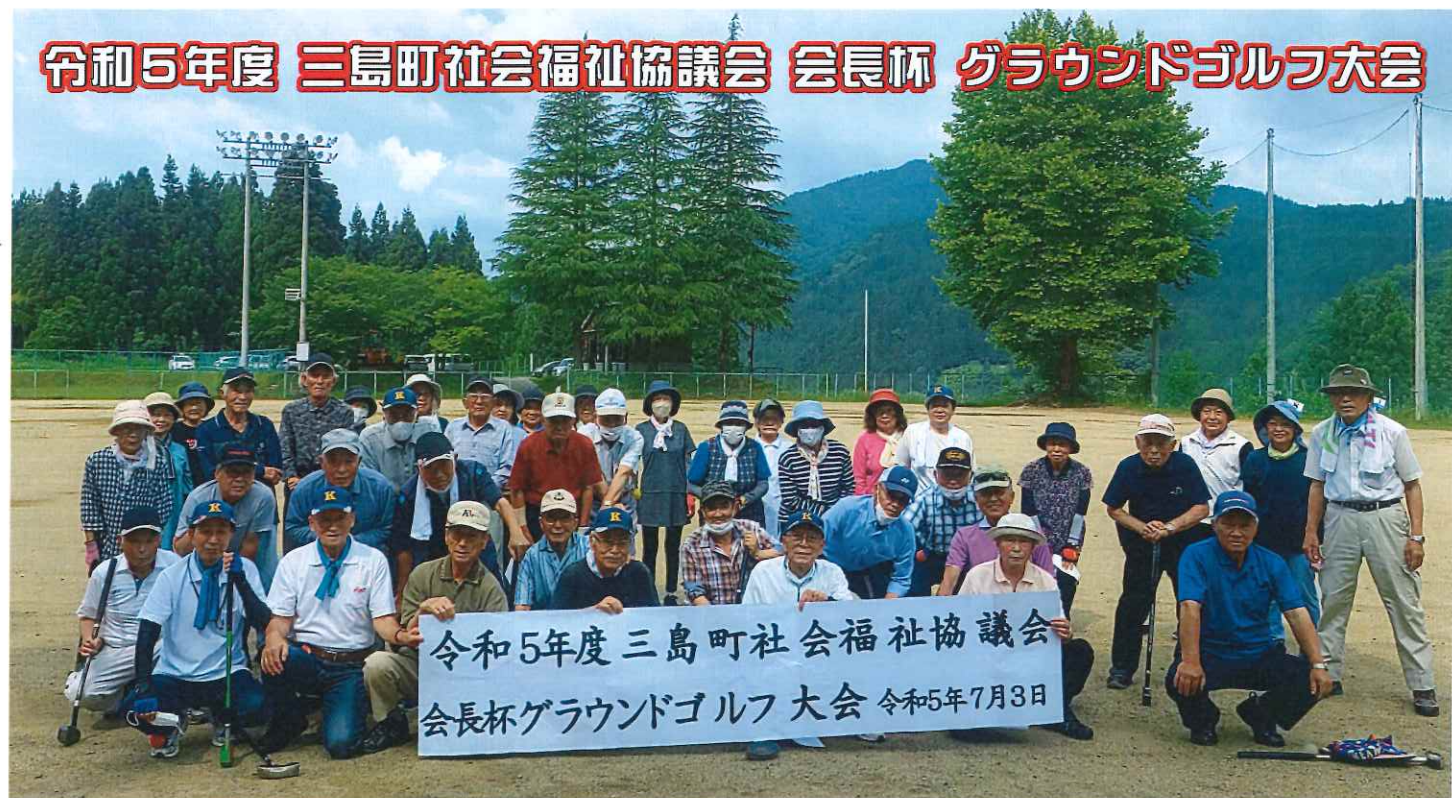
令和5年度 三島町社会福祉協議会 会長杯グラウンドゴルフ大会 令和5年7月3日