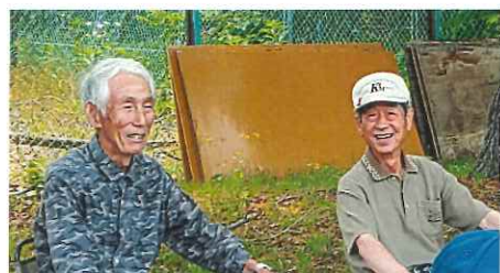
男の作戦会議中 「きょうどうだ?」 「ホールインワン狙ってただけんどな。」